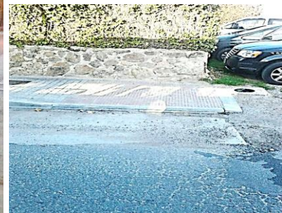
Fotografía nº 3