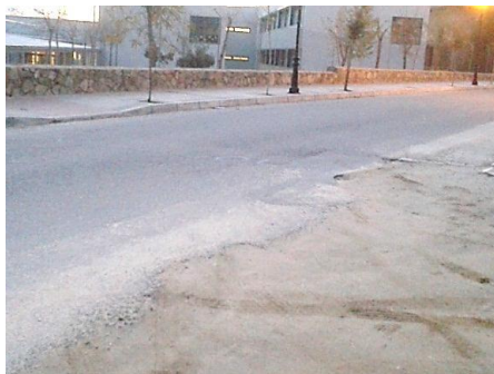
fotografía nº 2